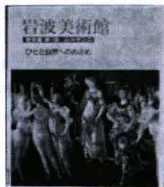
〔歴史館〕第9室ルネサンス

素晴らしい芸術に触れることは、大きな楽しみである。現在ではまだ5冊しかない書架が、月1冊づつ順に、新しい世界や夢を与えてくれる美術館でいっぱいになることを心待ちにしたい。